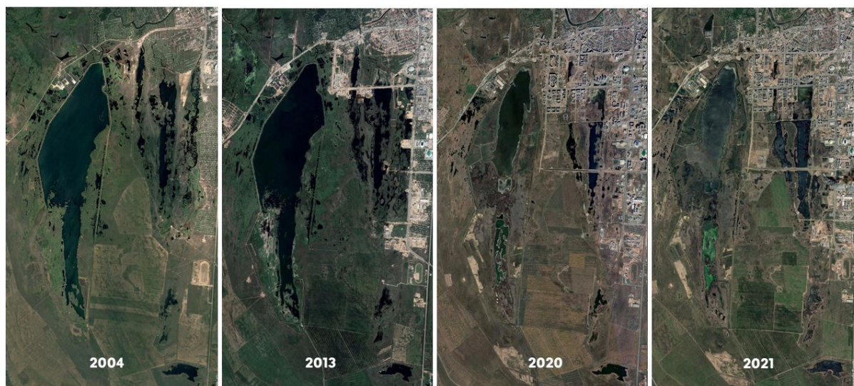
Рис. 2. Трансформация Талдыкольской системы озер в XXI веке.

К 2010 году город максимально приблизился к озерам. В период с 2012 по 2018 года часть озер оказалась под застройкой, где сейчас располагается западная часть проспекта Туран. Оставшиеся озера Малого Талдыколя сейчас представлены семью участками, на трех из которых ведется засыпка.